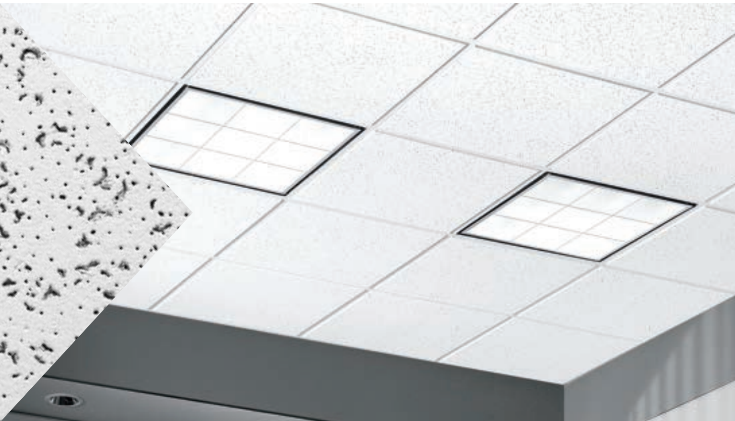
Panneaux Cortega téglulaires à angle avec système de suspension Prelude XL de 15/16 po

Panneaux de texture moyenne ; solution économique avec absorption acoustique standard.