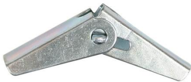
Cheville à ressort