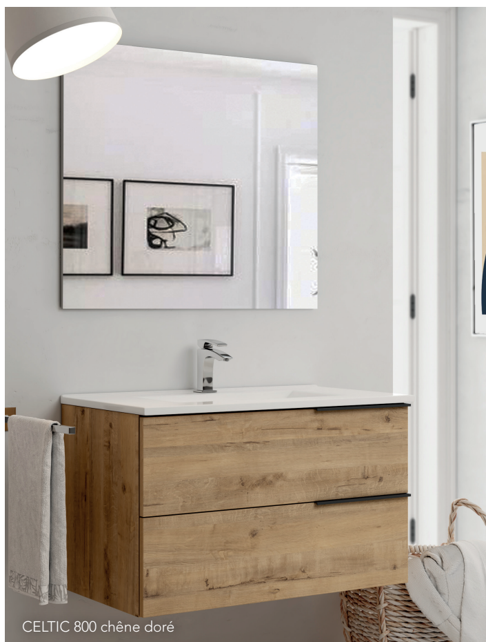
CELTIC 800 chêne doré