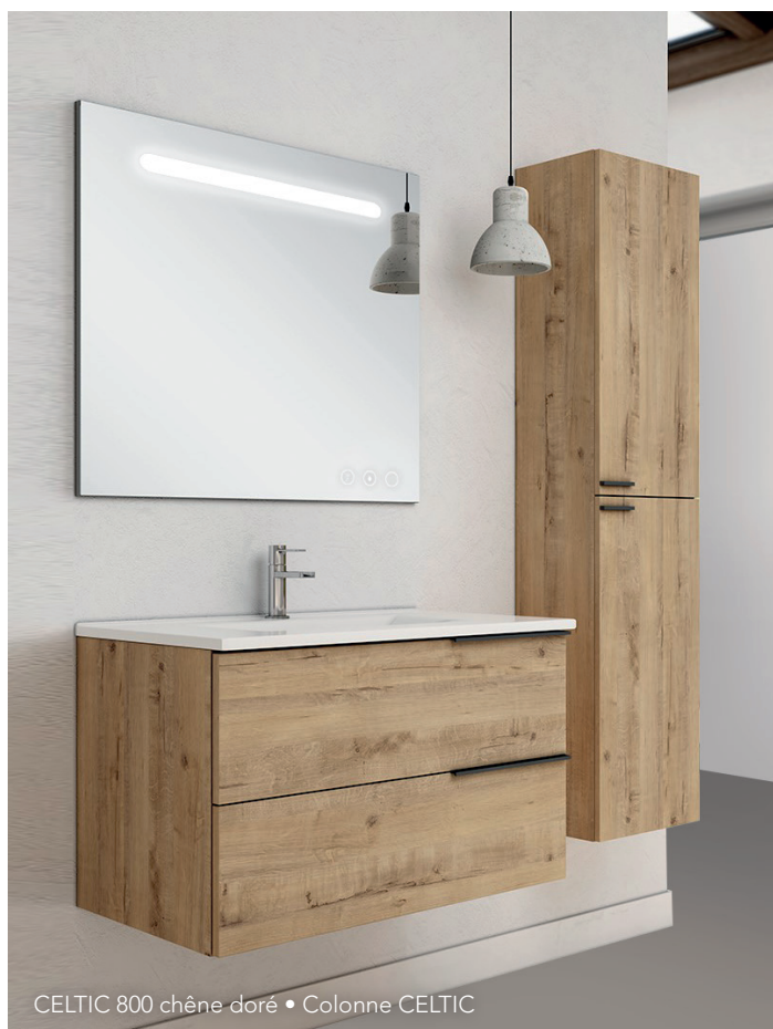
CELTIC 800 chêne doré • Colonne CELTIC