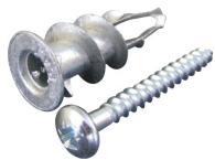
Cheville Plak métal + vis tête ronde