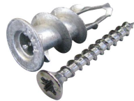
cheville plak metal + vis tête fraisée