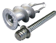
Cheville Plak métal + patte à vis M7