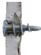
cheville Plak métal - vue en coupe