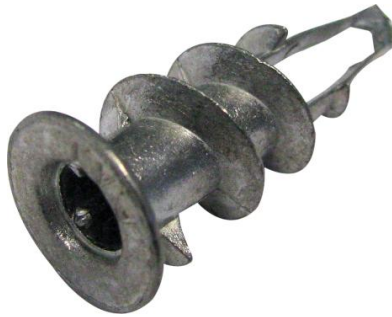
Cheville Plak métal