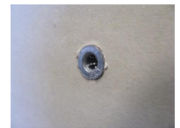
cheville Plak métal - vue en situation